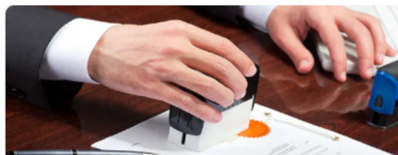
Legalització de documents comercials