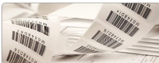
Certificat d'origen comunitari

Los trámites disponibles en formato digital (No presenciales) son el Certificado de Origen Comunitario y el de Legalización de Documentos Comerciales.