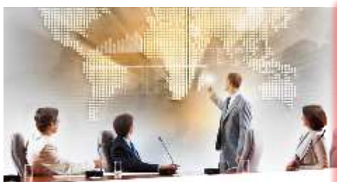
TRÁMITES PARA LA INTERNACIONALIZACIÓN

Ponemos a disposición de las empresas la posibilidad de solicitar los certificados de origen comunitarios a través de la oficina virtual de trámites: